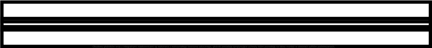
Czystość brzmienia zapewnia woofer o cewce z nawiniętym miedzianym drutem na aluminiowy karkas. Wyjątkowo wytrzymała membrana została wzmocniona formowanym ciśnieniowo polipropylenem. Szerokie zawieszenie głośnika daje miękki bas.