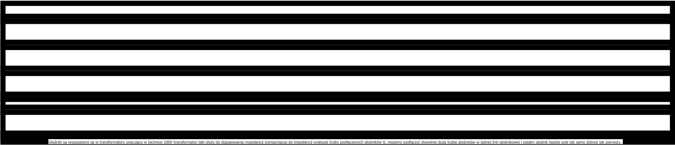
Głośnik sa wyposażone sa w transformator pracujący w technice 100V transformator taki służy do dopasowania impedancji wzmacniacza do impedancji większej liczby podłączonych głośników tj. możemy podłączyć dowolnie dużą liczbę głośników w jednej linii głośnikowej i ostatni głośnik będzie grał tak samo dobrze jak pierwszy.